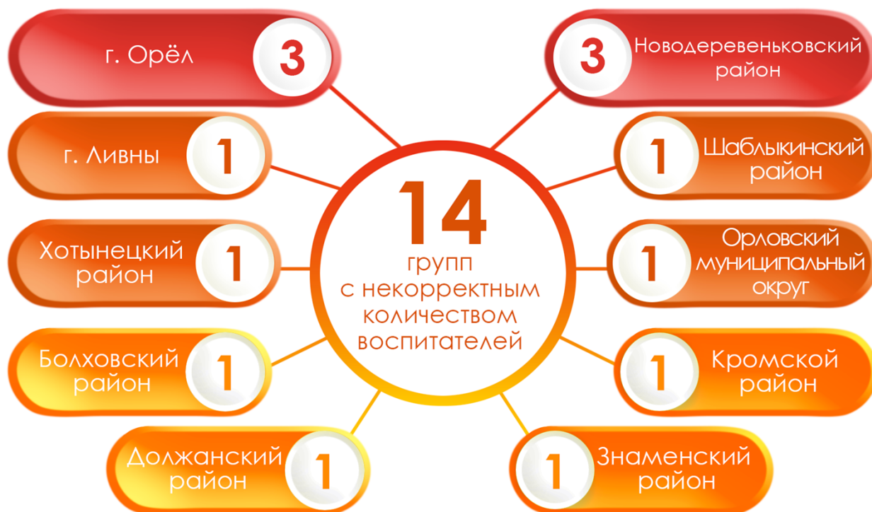
Рис. 2. Муниципальные образования, в которых указано некорректное количество воспитателей в группах

В группах общеразвивающей направленности с режимом полного дня: «Сказка» отделения по дошкольному образованию № 1 МБОУ «Знаменская средняя общеобразовательная школа» Орловского муниципального района, подготовительной к школе группе № 2 МДОУ детского сада № 9 г. Ливны, 1 младшей группе «Е» МБДОУ детского сада № 93 г. Орла, средней группе «Цыплята» МБДОУ «Центр развития ребенка - детский сад № 24» г. Орла, 1 младшей группе «А» муниципального бюджетного детского сада № 62 комбинированного вида г. Орла и группах «Зайчики», «Пчёлки», «Ромашки» МБДОУ «Хомутовский д/с» Новодеревеньковского района при отсутствии воспитанников в группах по два воспитателя.